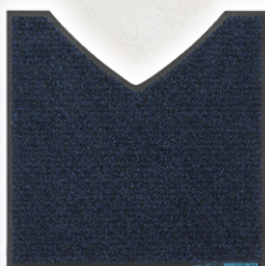
V型 (床置き小便器用)