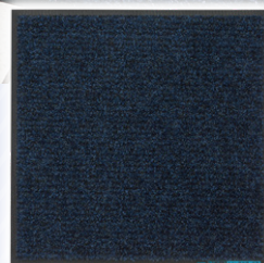
D型 (壁掛け小便器用)